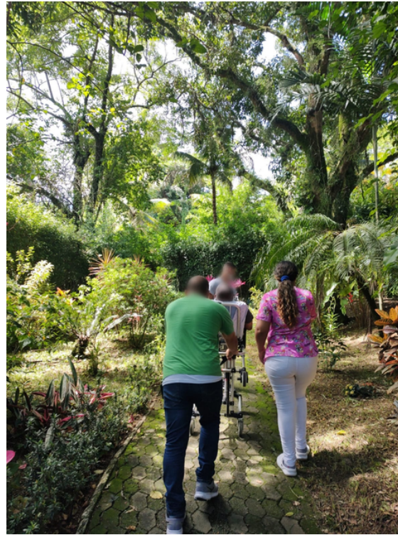
Caminho da Recuperação