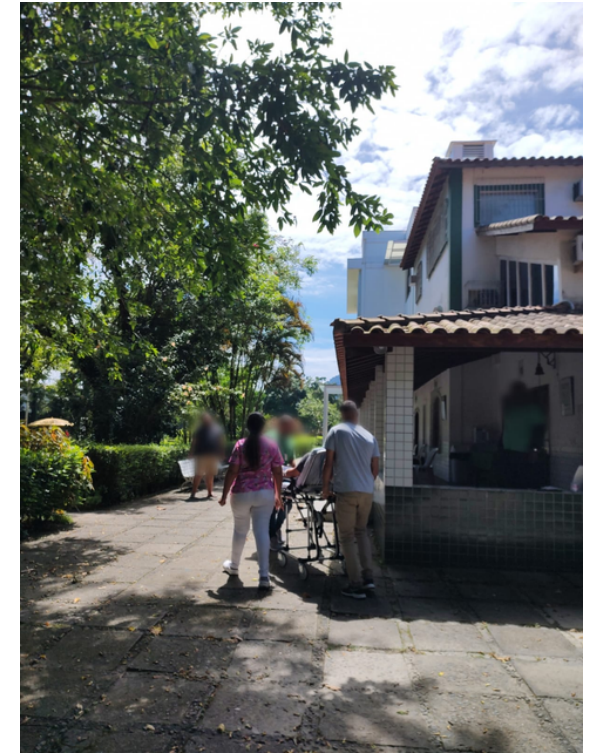
Entrada na Clínica