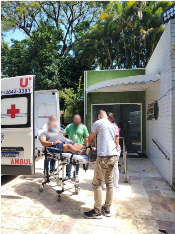
Chegada do Paciente